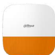
ARA13-W2-868 € 199,00

Telecomando 4 tasti (home, away, disarm, SOS), batteria CR2032