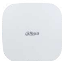
ARC3800H-FW2-868 € 618,00

Hub allarme wireless 4G da interno con 150 periferiche wireless, connessione cablata, Wi-Fi 4G, frequenza portante 868~868.6, alimentazione 100~240 Vac <12 W