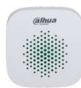
ARA12-W2-868 € 99,00

Sirena da esterno IP65, 110 dB, 12V/4 batterie CR123A